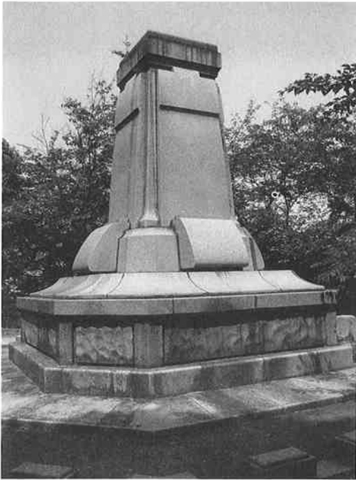
比治山公園内に残る台座