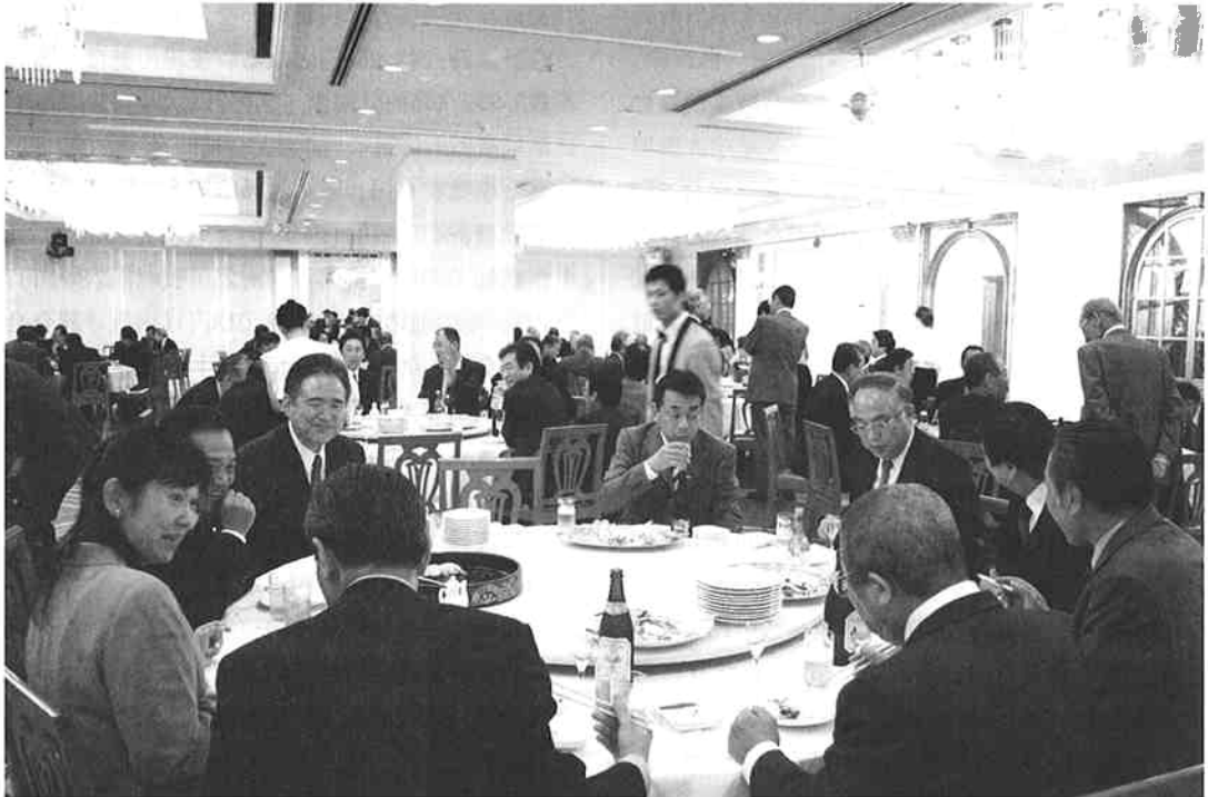
幹事・評議員合同懇親会の様子