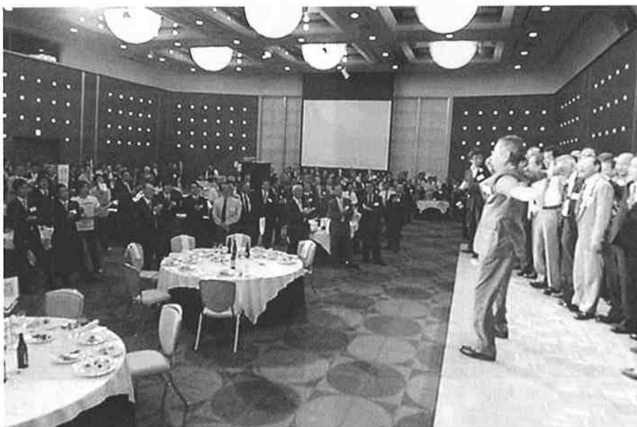
出席者全員での校歌斉唱