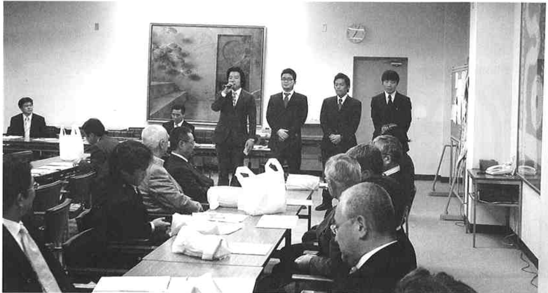
挨拶をする高校50回同窓大会世話人